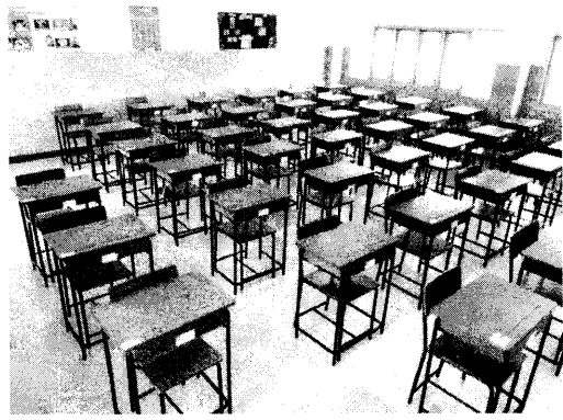
ตัวอย่างการจัดโต๊ะ เก้าอี้ เว้นระยะห่าง 1 เมตร